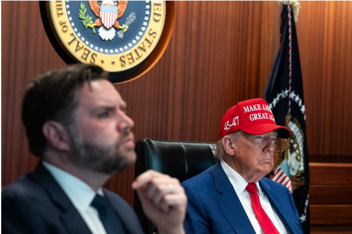
Le vice-président américain, J. D. Vance, et Donald Trump à la Maison Blanche, à Washington, le 21 juin 2025.

Le divorce est consommé, en attendant la séparation des biens. Ainsi se dessine, du point de vue transatlantique, la publication de la stratégie de sécurité nationale par la Maison Blanche , vendredi 5 décembre. Cet exercice classique, qui permet de formaliser les priorités d'une administration mais aussi plus largement sa vision du monde, marque une rupture historique. Jamais encore un document officiel de cette nature n'avait été marqué par une telle nonchalance envers les adversaires de l'Amérique, et une telle maltraitance réservée à ses alliés traditionnels, surtout européens.