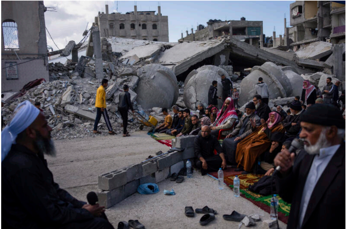
Des Palestiniens prient devant une mosquée détruite par les frappes aériennes israéliennes à Rafah, dans la bande de Gaza, le vendredi 8 mars 2024.

Ces derniers jours, plusieurs pays arabes et occidentaux, dont les Etats-Unis et la France, ont effectué de nombreux largages aériens de nourriture. Mais ces parachutages, de même que l'envoi d'aide par la mer ne peuvent se substituer à la voie terrestre, estime l'ONU qui met en garde contre une « famine généralisée presque inévitable » à Gaza. « La diversification des routes d'approvisionnement terrestres reste la solution optimale » selon Sigrid Kaag, la coordinatrice de l'ONU chargée de l'aide pour Gaza.